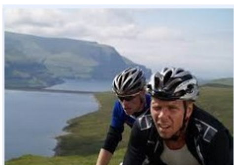
Et les ascensions poussent à la grimace