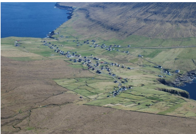
FRO-005 Við Garð Hoygarðsvegur, site historique