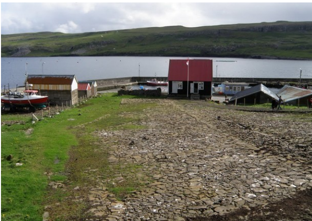
FRO-023 Hov Mýri museum