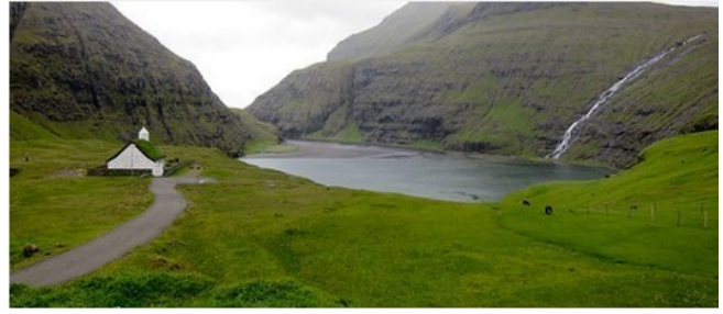
FRO-012 Frammi á vatni 400m à 20 % sont présents dans un profil en dents de scie