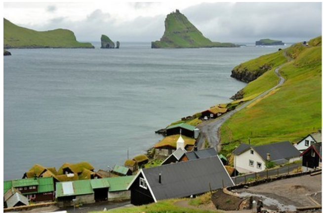
FRO-018 Húsadalsvegur Un mur de sortie de mer