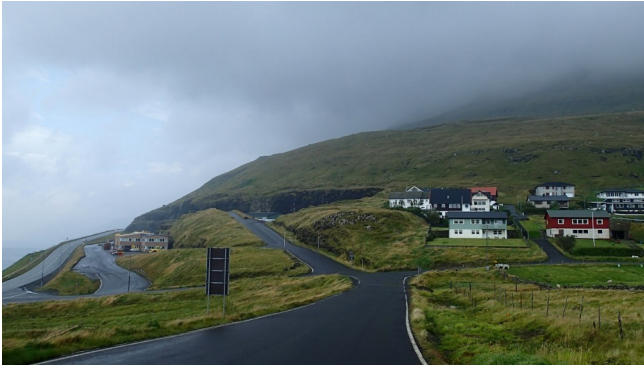
FRO-011 Hústoft Le versant nord-ouest a deux sections supérieures à 20 %