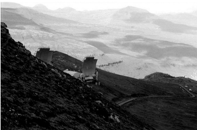
FRO-015 Sornfelli Ascension terrible avec plus de 1000 €-points