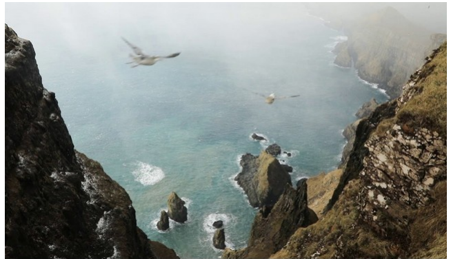
FRO-025 Beinisorð (Sumba Old Road) falaise de 470m de haut