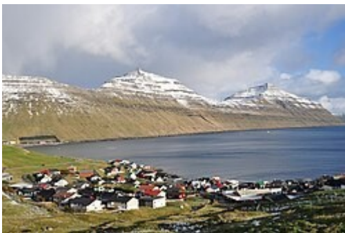
Village de Syðrugøta avec Sigatindur (612m, au centre) et Gøtunestindur (625m, à droite) sur Eysturoy