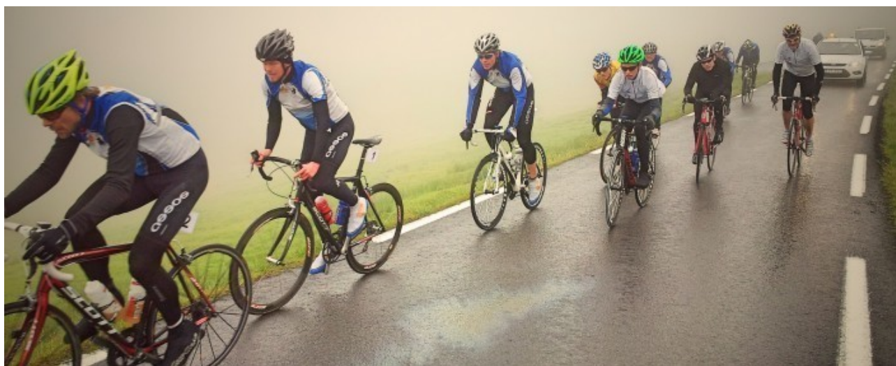
Les conditions météo sont évidemment parfois ... nordiques