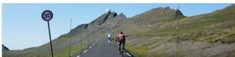
En se limitant à 30 km/h, s'il-vous-plaît !