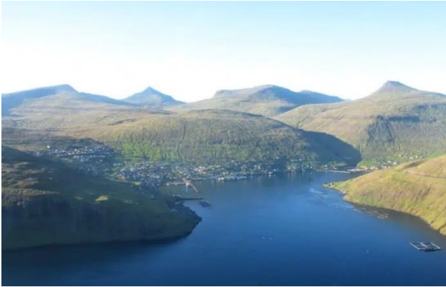
FRO-013 Mýranar Le point de vue Vestmanna