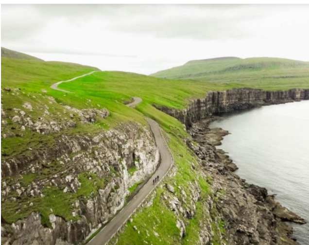
Petits groupes sur routes en corniche

Du côté des cyclotouristes, les clubs ne sont pas nombreux mais les agences qui prévoient des randonnées accompagnées de plusieurs jours sont plus fréquentes. Seul le club cycliste de Tórshavn, Tórshavnar Sùkkulufelag, semble dynamique.