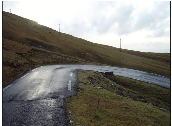
FRO-025 Beinisorð (Sumba Old Road) 5,7 km à 6,4 % avec 13 % de maximum