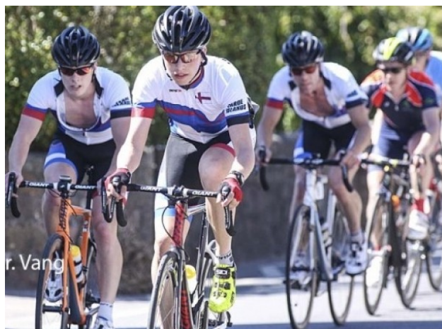
Le maillot national féroïen est à l'honneur