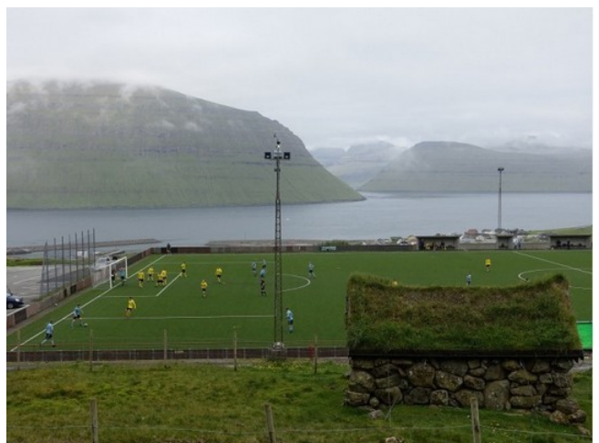
FRO-007 Uppi á Brekku Stade de football initial des îles Féroé à Leirvík