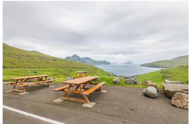
FRO-014 Vestmannavegurin Le versant nord a une partie initiale et une partie finale à 20 %