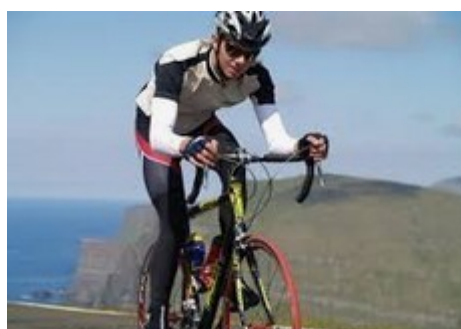
Ferailler aux Féroés