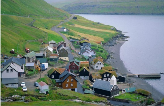
FRO-019 Giljavegur Un final de 300m à 20 %