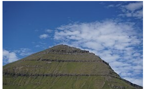
Vue du Slættaratindur (882m) en été.