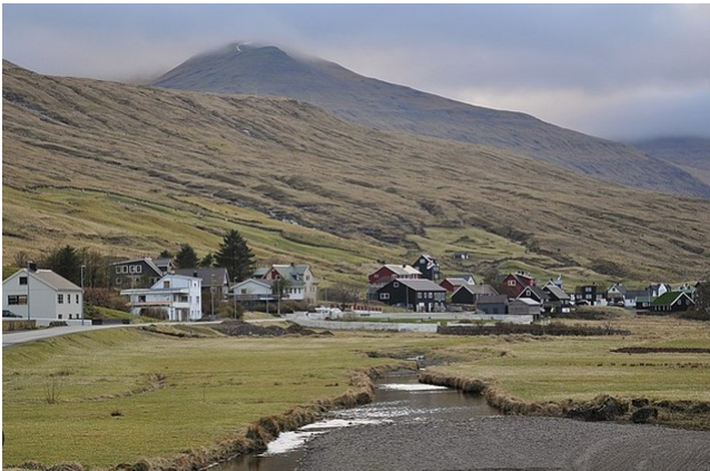
FRO-013 Mýranar Une côte régulière mais rare avec plus de 7 kilomètres à 5,6 % de moyenne