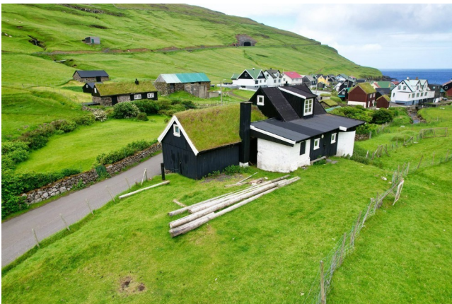
FRO-024 Tindur (Dalsvegur) Un toboggan féroïen de 4 sections à 20 %