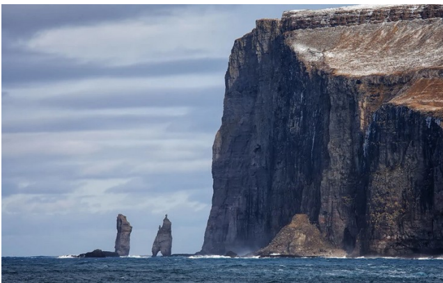
FRO-006 Eiðisskarð célèbre point de vue des rochers Risín et Killingin