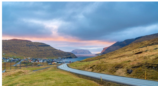
Tout le charme des paysages féroïens