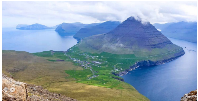
FRO-005 Við Garð Villingardsfjall et ses falaises dômes impressionnantes