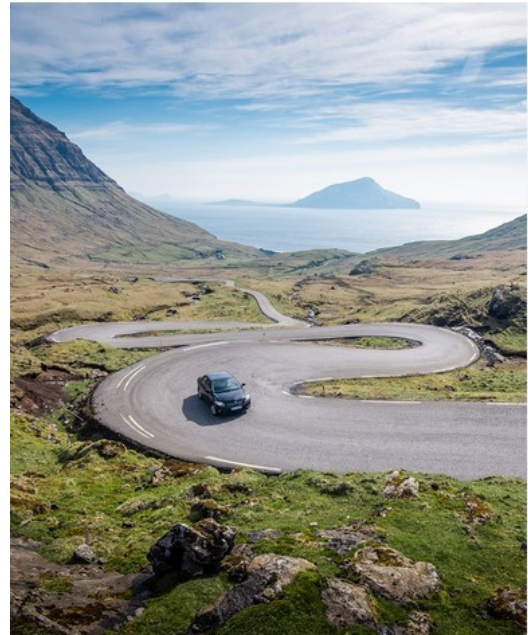
FRO-023 Hov Beaux lacets avec plus de 200 €-points