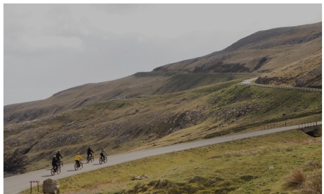
Et dans une ascension de notre sélection