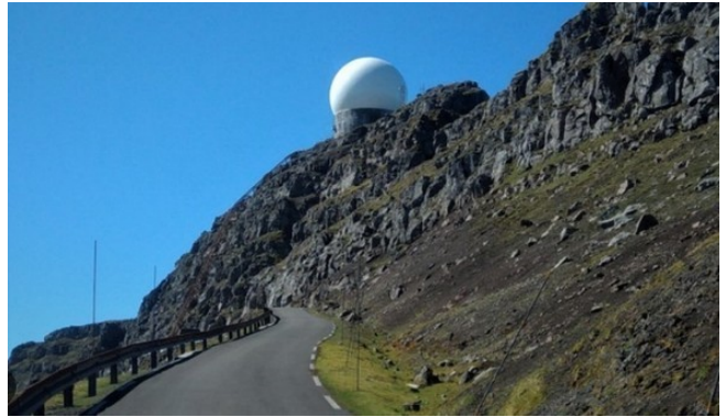
FRO-015 Sornfelli Base Radar et panorama