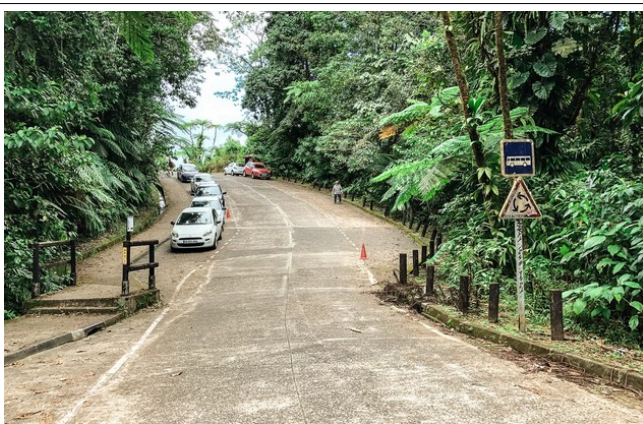
Rive nan Kabwèt otòn yo