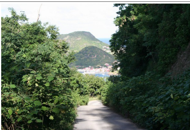
Morne de la Mémoire nan tèt la Aymes