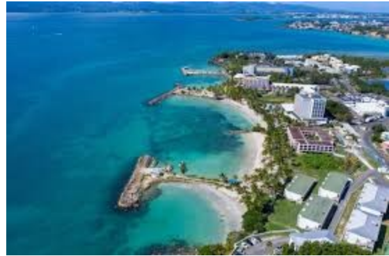
Resort lanmè a nan Le Gosier