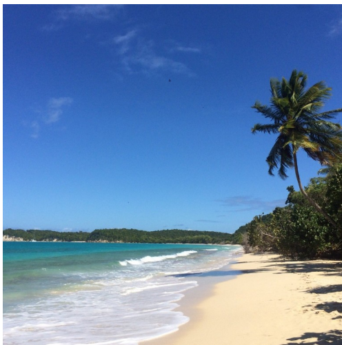
Plaj la nan Moustik de Marie-Galante

Zile yo nan Les Saintes, separe ak "tè pwensipal Gwadeloup" pa Canal des Saintes, yo te fè leve nan nèf zile ak isit la, de nan yo ki yo rete: Terre-de-Haut ak Terre-de-Bas. Achipèl la se yon ti kòd nan zile Arid ak etap (gade GLP-026 ak GLP-027). Pou wè: Jaden ekzotik la ak Fort Napoleon tou pre GLP-027.