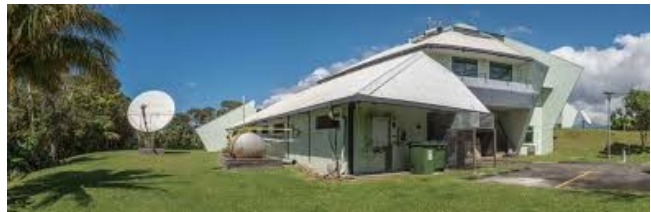
... a Ak obsèvatè li nan Houëlmont