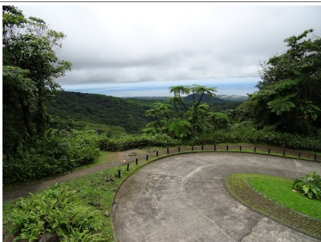
... nan fen kwasans li