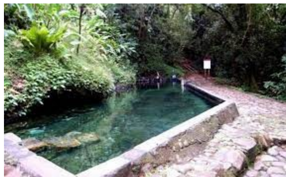
Basen jòn yo