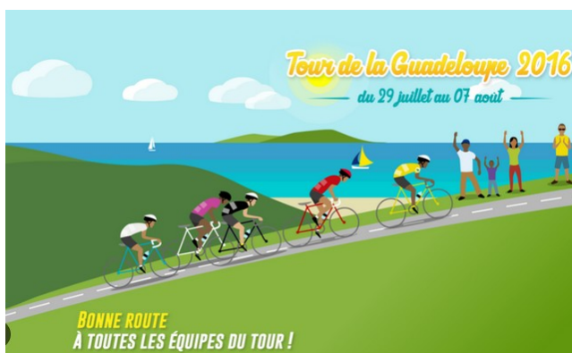
la Envitasyon trase nan 2016