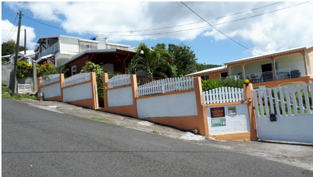
Pant vilaj nan Morne Surelle

Vòlkan an Soufriere, ak aksè li nan Jaunes Bains (GLP-016) se pi bon an nan Gwadeloup ak 1011 pts sou bò dirèk SW li yo ak 1215 pts sou bò Wòch li yo.