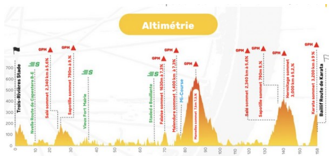
La Des Mamelles domine altimetri a