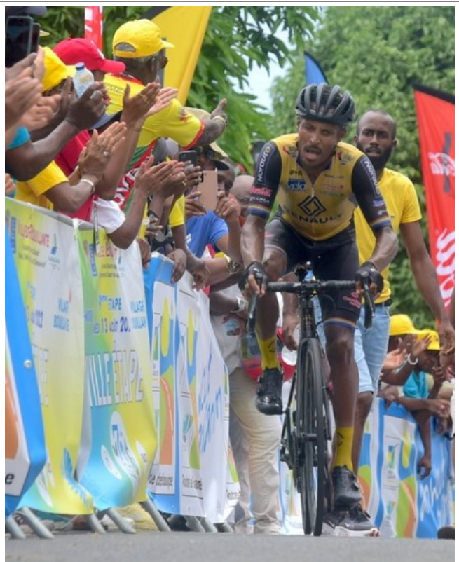
la Boris Carène nan finisman an