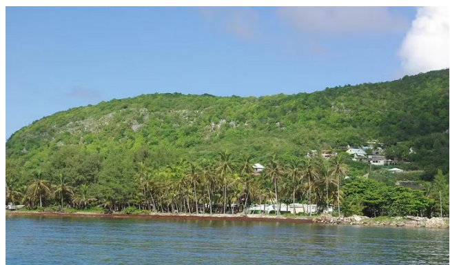
Gwo mòn Désirade