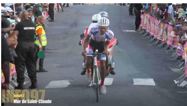
Saint-Claude ak mi li nan yon jijman tan

Zile a nan Grande Terre gen lòt GPMs, ki pi klasik la nan ki se Saline (GLP-024). Dubisquet (GLP-022) ak Masselas (GLP-023) yo se 2 lòt GPMs soti nan Grande-Terre.