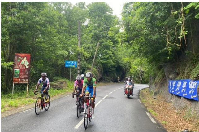
Tour monte bisiklèt nan Gwadeloup 2022 Yon nevyèm etap montay

Tour de Guadeloupe te vin entènasyonan nan lane 1979, te anrejistre ak UCI an 2005, e li te klase kòm UCI Ewòp Tour 2.2 depi 2014. Sa a te touche li konpetisyon soti nan ekip pwofesyonèl ak amatè soti nan seleksyon nasyonal, rejyonal oswa klib.