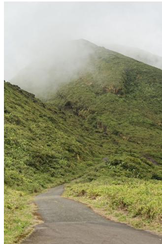
Ak pant aksè li yo