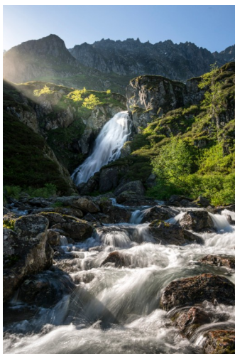
Kask dlo garbet