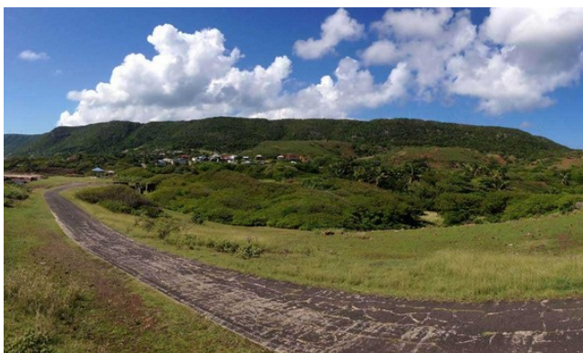
Liy kontou nan Morne Davi