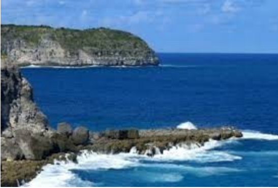
Pointe de la Grande Vigie

Gade sou kòt sa a Etang de la Saline (pye GLP-024).