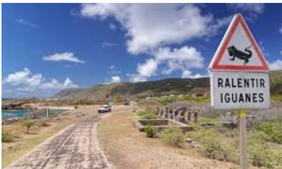
Panno orijinal sou pye