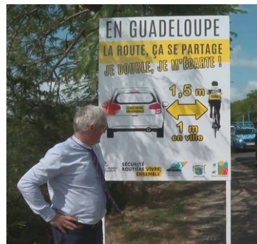
yo Ak klè ak siy klè sou wout la

Eskalad siklo-eskalad la ap gen pou bra tèt li ak angrenaj trè modès ak kouraj monte nan Gwadeloup. Nan 52 monte yo chwazi nan Gwadeloup, 30 gen pasaj omwen 15%, 14 omwen 20% ak 5 omwen 25%.