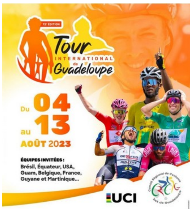
Logo edisyon 2023

Tour siklis entènasyonal de la Guadeloupe se ras prensipal monte bisiklèt nan achipèl la. Ras sa a te kreye nan 1948 ak fèt nan 2 etap nan moman an. Li se kounye a konpetisyon nan 10 etap nan kòmansman mwa Out.