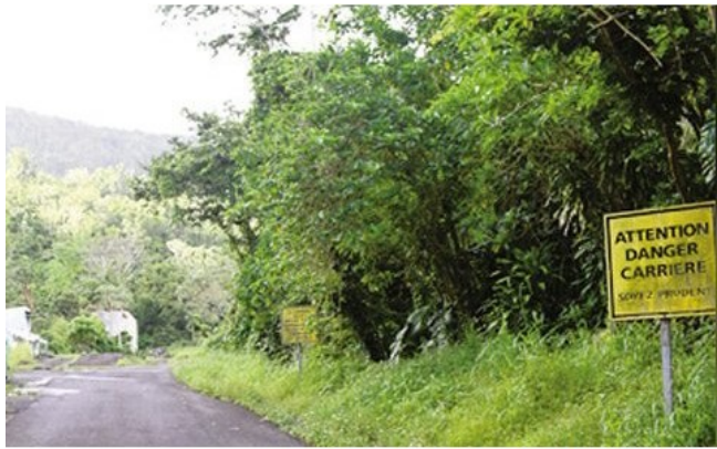
La Regrèt, èske w regrèt sa?