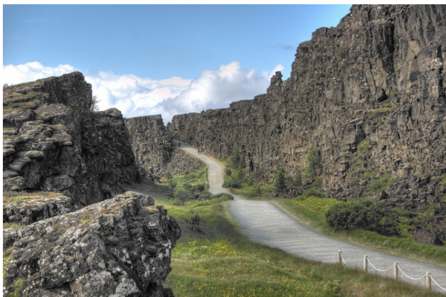
Almannagjá í Þingvallarþjóðgarði

Sagan er illa sýnd. Auk jarðvegsmisgengisins hýsir Þjóðgarðurinn á Þingvöllum einnig rústir fyrsta Evrópuþingsins (Alþingi, sem er frá 930).