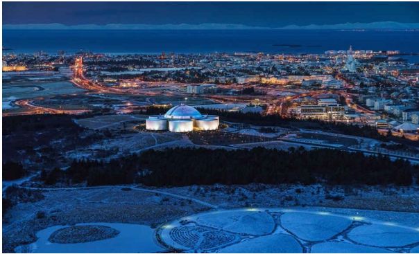
Perlan um nóttina

Í hina áttina, efstu 4 af þeim auðveldustu, sem hafa áhuga á ferðamönnum: 008-Látrabjarg (blett- og fuglafriðland, 25m), 038-Reykjanesviti (elsti viti eyjarinnar, 30m), 079- Dettifoss (glæsilegur augasteinur, 43m) og 033-Perlan (víðsýni yfir Reykjavík, 49m).