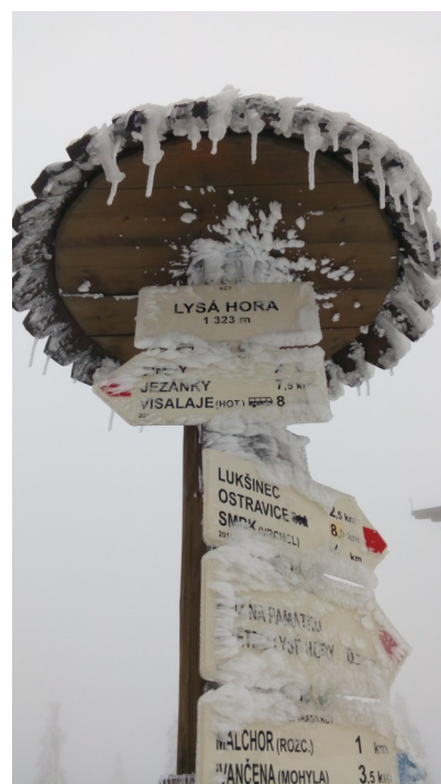
Lysá Hora (1323m)

* výstup klasickou cyklokrosovou cestou, České ráje nebo nádherná krajina v masivu Jeseníků,