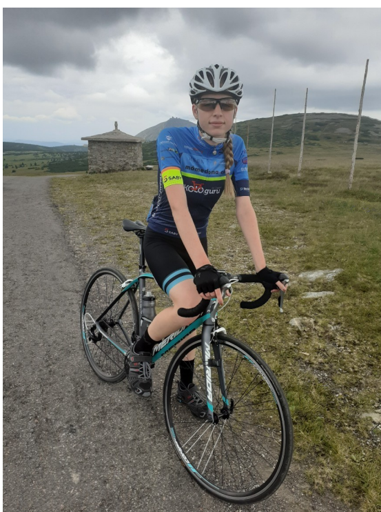
Modré sedlo (1510m)