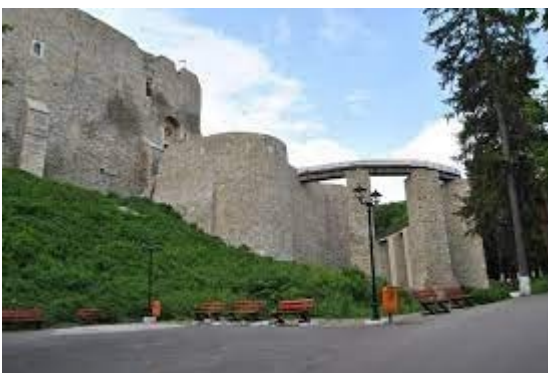
Citadelle de Târgu Neamț

Subcarpatul este reprezentat de cetatea ce domină Târgu Neamț, trei mănăstiri (Ciolanu, Dealu și Probota la poalele Tătărușilor), un drum de la Dunăre (Ghelvegioaia), podgoriile Tohandans (în Jugureni) sau o coastă încă din primul tur. a României în 1935 (Petricica lângă Bacău).