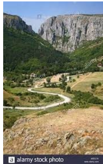
Cheile de Cheile

Subcarpatul este reprezentat de cetatea ce domină Târgu Neamț, trei mănăstiri (Ciolanu, Dealu și Probota la poalele Tătărușilor), un drum de la Dunăre (Ghelvegioaia), podgoriile Tohandans (în Jugureni) sau o coastă încă din primul tur. a României în 1935 (Petricica lângă Bacău).