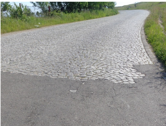
Stana de Vale

La vest, cele mai înalte vârfuri sunt între 1000 și 1500m, între Beius și Cluj-Napoca: Buscat, Stâna de Vale și Semenic, lacurile Beliș-Fântânele și Drăgan, platoul Padiș sau pasurile Ursoia și Vartop.