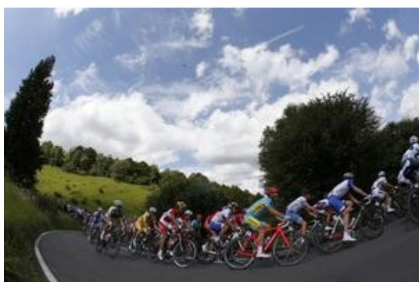
Paths of King Nikola pozivaju na penjanje