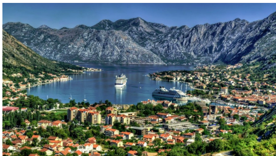
Poznata Kotoranska uvala