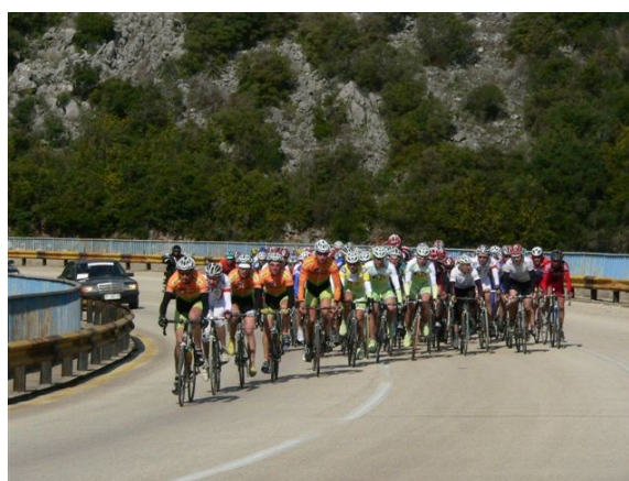
Peloton trke Paths of King Nikola