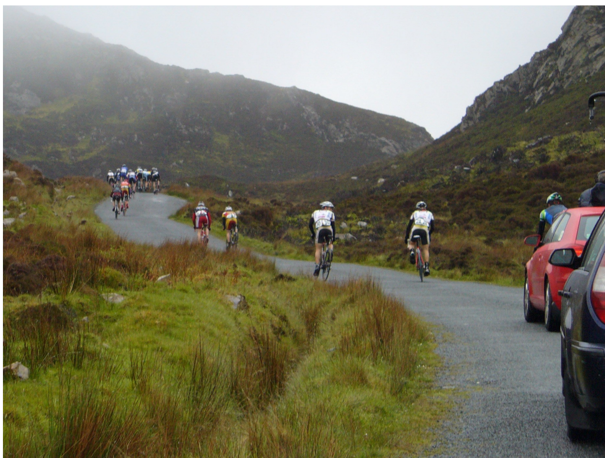
Peleton se raspršava po planini tokom trke Paths of King Nikola