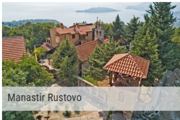
Ovaj manastir čuva sa visina