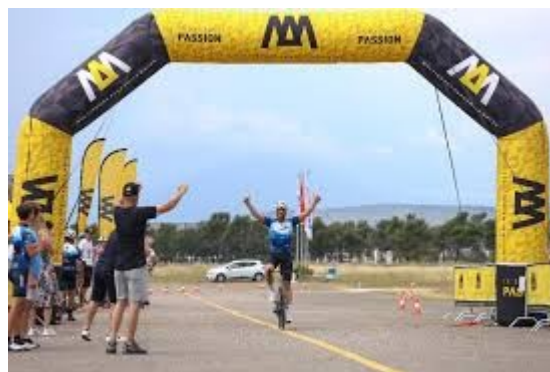
Slobodan Milonjić osvaja nacionalno prvenstvo na putu

Samo je obilazak Staza kralja Nikole ( Paths of King Nikola ) omogućio da istaknemo nekoliko nacionalno medijski poznatih mesta kao što su Kruševica, Poljice ili Stegvaš.