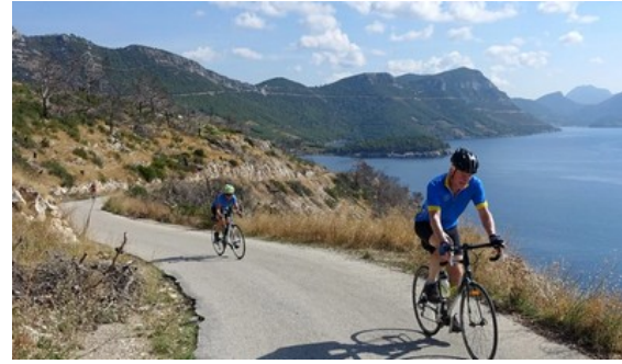
Put prema Cetinju

Zimske stanice postoje u tim planinama MNE-036 Krnovo (Vučje ski centar)