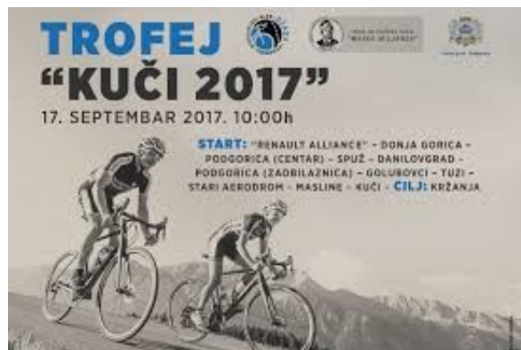
Trophy Kući u nedjelju