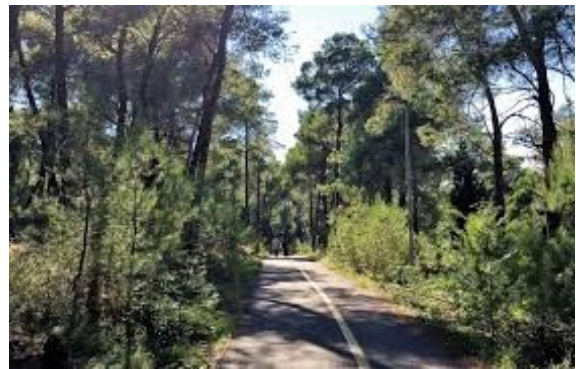
Šumski park Gorica