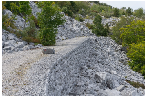
Muleći put kroz Orjen