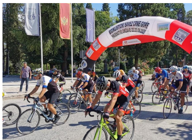
Prolazak nacionalnog pelotona