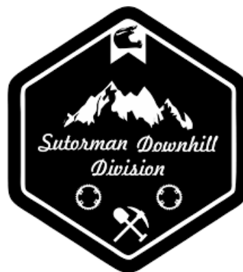
Planinarski klub Sutorman