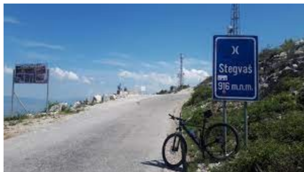
Zvanična tabla prevoja Stegvaš