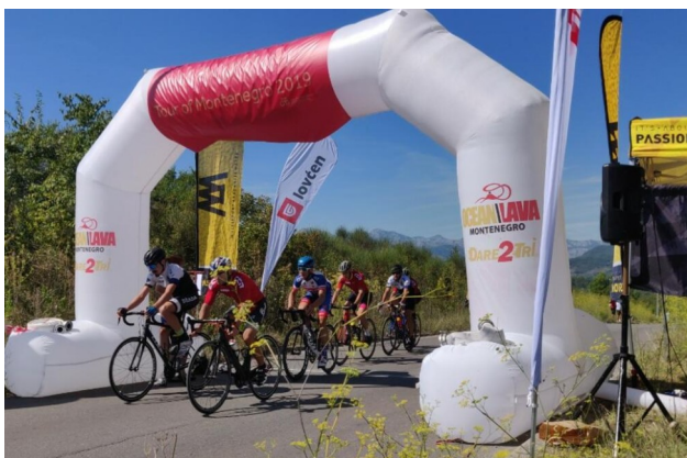
Kotor-Lovćen u subotu

"Tour du Montenegro" je originalan primjer. Dva dana su podijeljena ovako: Kotor-Lovćen Grand Prix koji služi kao nacionalno prvenstvo u subotu i "Trophy Kući" u nedjelju.