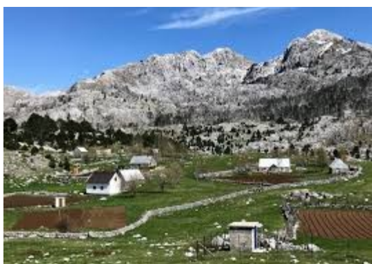
Brskut, stanica na kraju svijeta