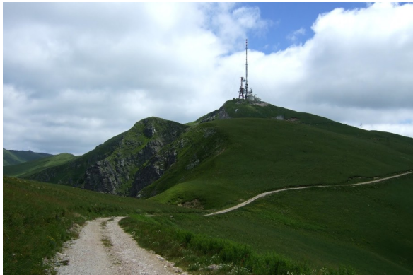
Vrhunac Zekove Glave