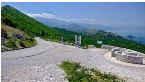
Ruta i panorama Stegvaša