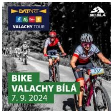
Pozvánka na Valachy Tour