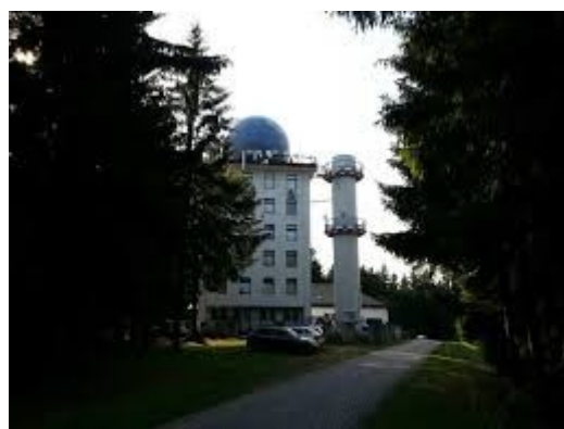
Příjezd na Buchtův kopec

Nakonec elita shromáždí ty, kteří jsou bombami a přesahují 400 eurobodů