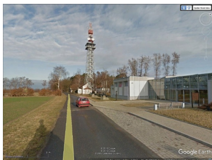
Chlum v reálu