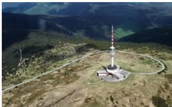
Kruhový vrchol Pradědu