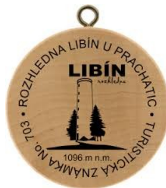
Medailon Libínské věže