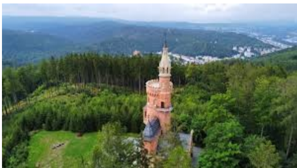
Goethova dominuje prostředí