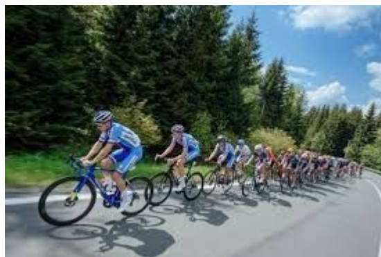
Závod míru četa