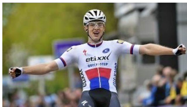
Petr Vakoč vyhrává Flèche Brabançonne