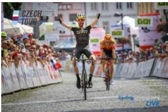
Příjezd na vrchol na Tour of Czechia