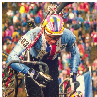
Radomír Šimunek vyhrál v roce 1991 mistrovství světa v cyklokrosu

Na začátku 21. století vyhrál Roman Kreuziger v roce 2008 Tour de Suisse, Tour de Romandie 2009, San Sebastian Classic 2009 a Amstel Gold Race 2013.