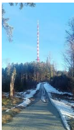
Příjezd do Kletu