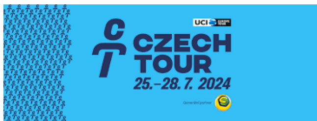
Czech Tour 2024 a její logo

GPM1 2022-04, Uphill Finish 2023-02 GPM1 Uphill Finish 2022-03,2024-03 Czech Cycling Tour Classical GPM2 2022-04, ... GPM2 2022-03,2023-03 GPM1 Uphill Finish 2022, 2023, 2024-04