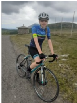
Modré Sedlo mladý Čech v nadmořské výšce 1510 m