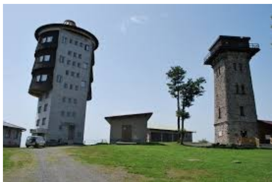
Čerchov v 1042m