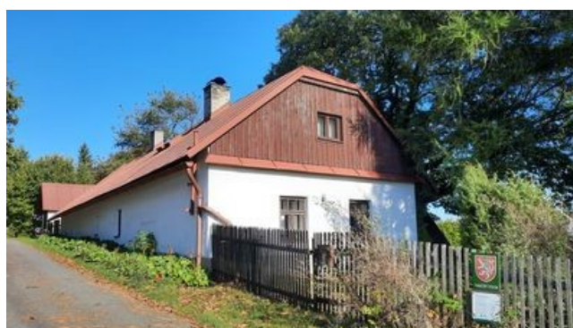
Svah Horní Vestec