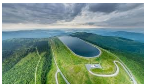
Unikátní lokalita Dlouhé stráně