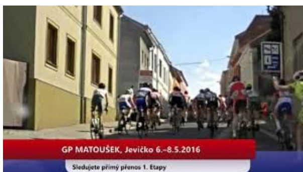
Závěrečný výstup na GP Matoušek