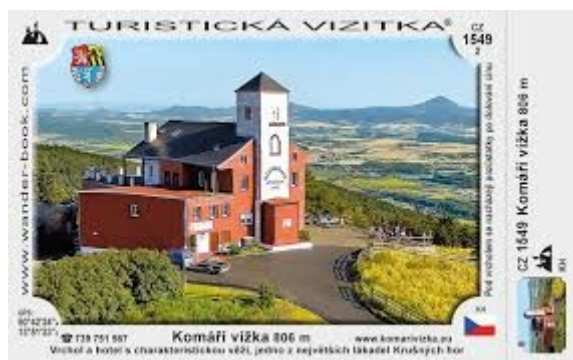
Pohlednice z Komáří Vížky