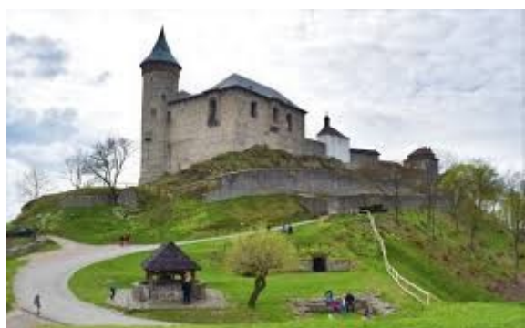
Svahy vedoucí ke hradu Kunětická hora