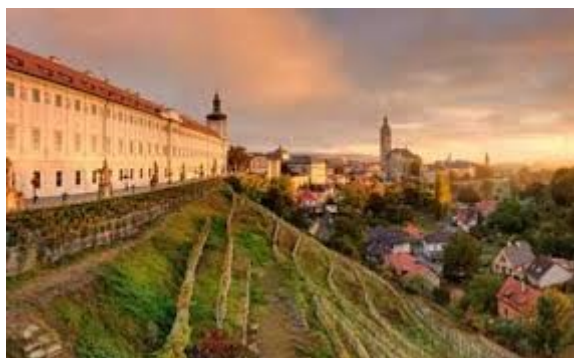
Svah historického centra Kutné Hory

CZE-026 Měděnec Mining (Mědník Mining Landscape)