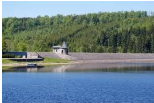
Vodní nádrž Souš na Smědavě