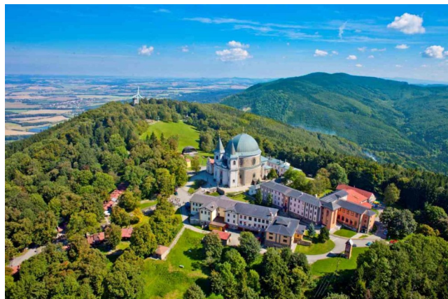
Hostýnská bazilika na kopci