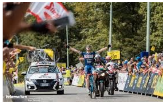
Jan Hirt remporte le tour d'Autriche 2016

Czech Tour (dříve Czech Cycling Tour, poté Sazka Tour) je mužský etapový silniční cyklistický závod, který se soutěží v České republice.