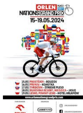
A na Grand Prix Orlen

Integrované jsou jednodenní akce z českého kalendáře