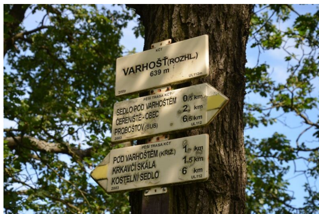
Cedule na průsmyku ve Varhošti - sedlo