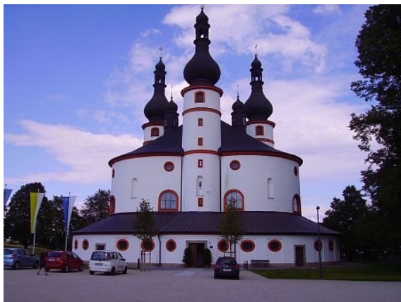
Zvonice Svata Trojice