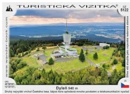
Pohlednice od Dylana