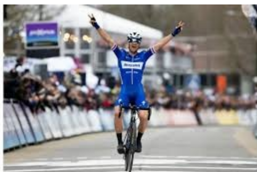
Vítězství Zdeňka Štybara na Dauphiné Libéré

Petr Vakoč v roce 2016 zejména vyhrál Brabant Flèche a také etapu na Tour of Poland 2014.