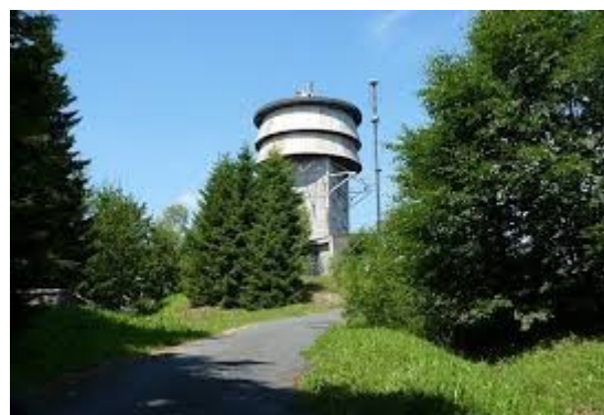
Konečná rampa pro Velký zvon