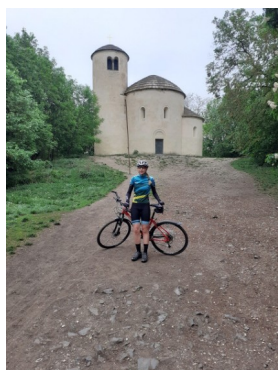
Ríp a jeho 3 dungeony