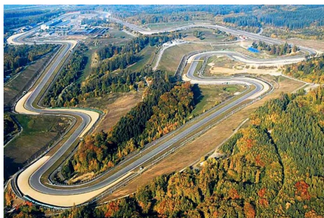
Brněnský závodní okruh a jeho prudký kopec

Pořádají se závody do vrchu a o tom svědčí náš seznam