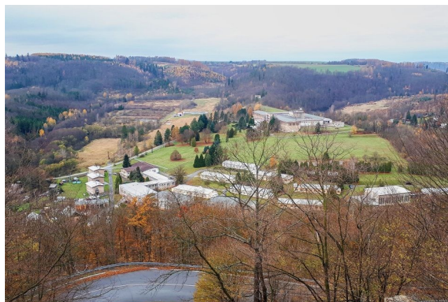
Cesta na hrad Vikštejn