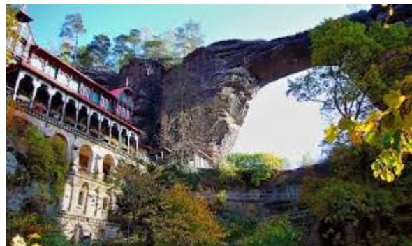
Výjimečná lokalita Pravčická brána v Českém Švýcarsku