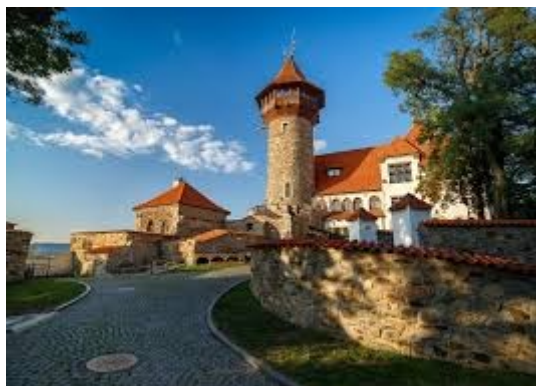
Příjezd na hrad Hněvín