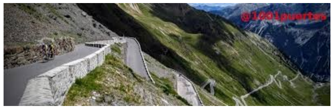
Collada de la Gallina

També hi són presents panoràmiques i miradors: