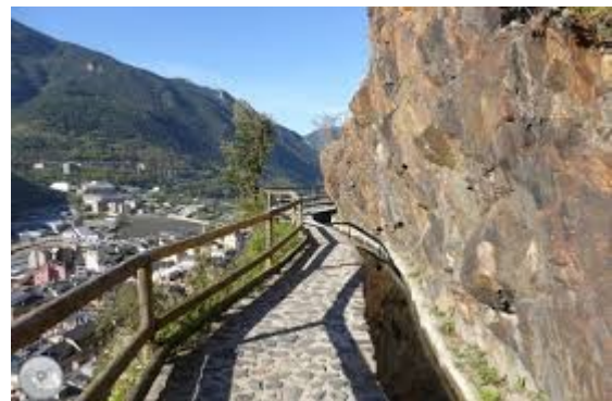
El Rec de Sola original i els seus punts de vista