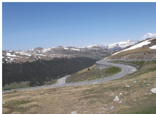
...i els seus cordons

Molts altres han combinat la demanda d'energia i el fort pendent amb, a més dels 800 euros superats, l'aparició d'una bomba força explosiva