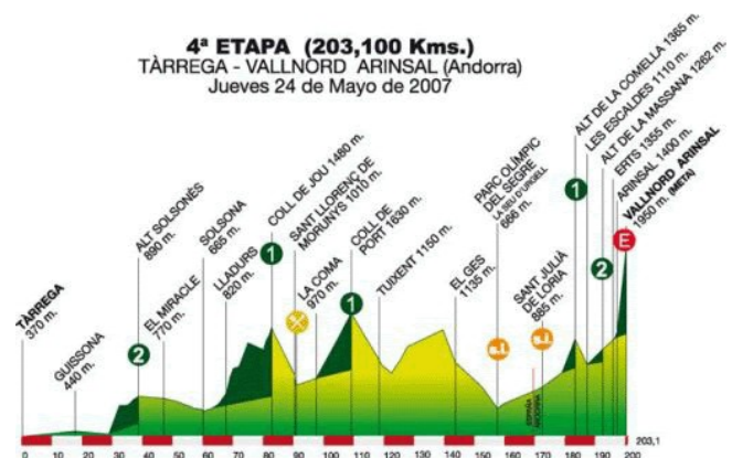
El pistolero Alberto Contador guanya a Andorra