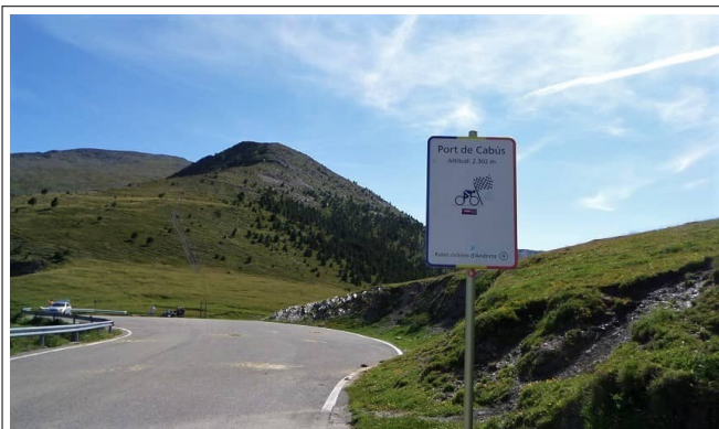
El Port de Cabus us dóna la benvinguda

AND-001 Arcalis AND-003 Arinsal AND-004 Port de Cabus AND-008 Pic de Carroi AND-017 Els Cortals AND-023 Collada de la Gallina AND-025 Bosc de la Rabassa