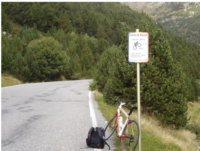
Panell a Coma de Ransol