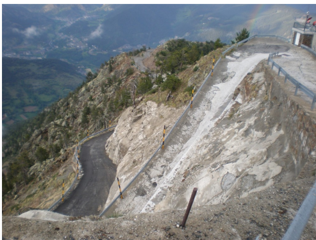
El final infernal del Pic de Carroi