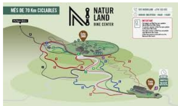
Els senders del Naturland Bike Center