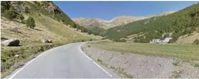
Coma de Ransol