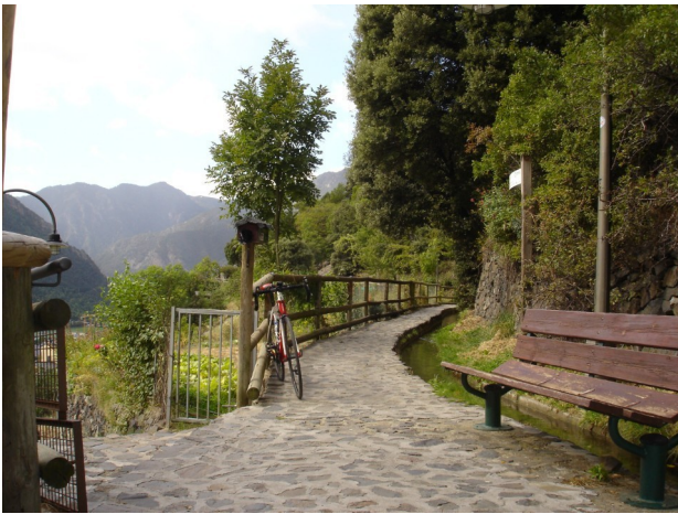
Rec de Solà