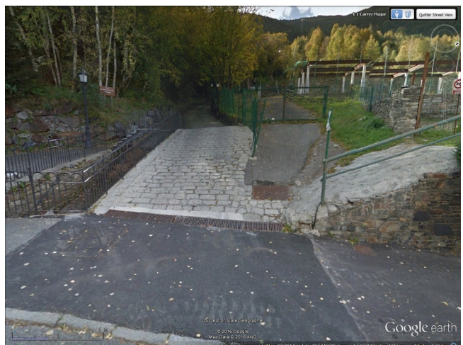
Les sorpreses de Salze