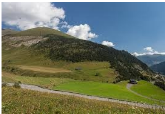
La carretera del Port d'Ordino