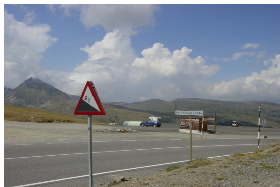
El panell de cimera d'Envalira, el pendent