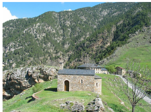
El petit poble d'Aixàs