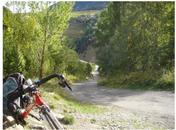
Camí del Riu d'Urina