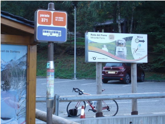
Ruta del Ferro