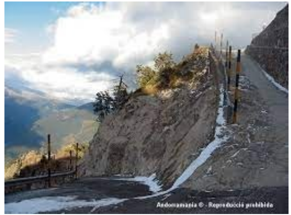
Pic de Carroi