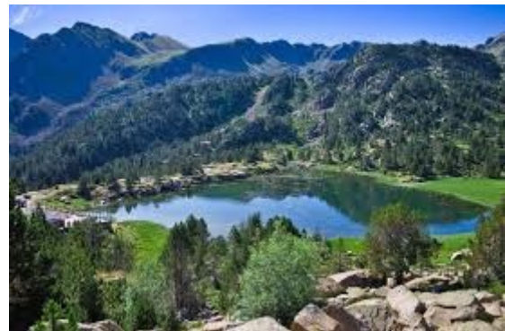
La vall del Madriu-Perafita-Claror

En aquest entorn, les estacions d'esquí són evidentment molt presents: