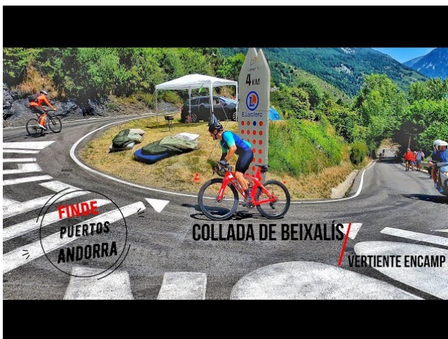
Els segueixes a Beixalís?