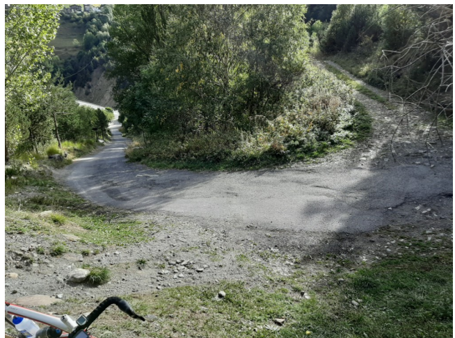
La famosa corba del Riu d'Urina