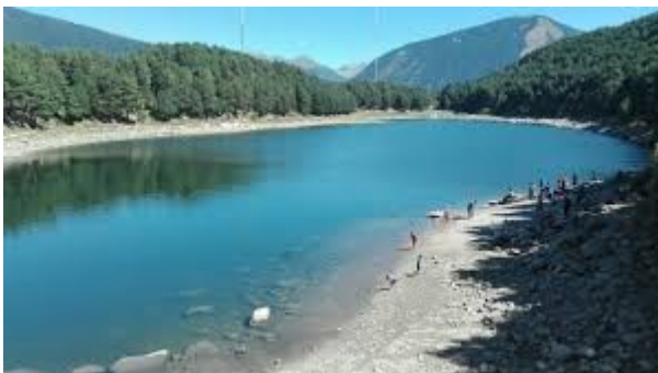
Engolasters i els seus navegants