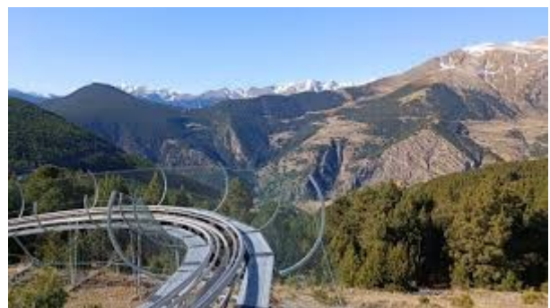
El tobogan màgic de Grandvalira