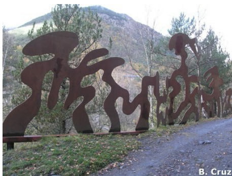
Ruta del Ferro

AND-025 Bosc de la Rabassa Naturland Bike Center