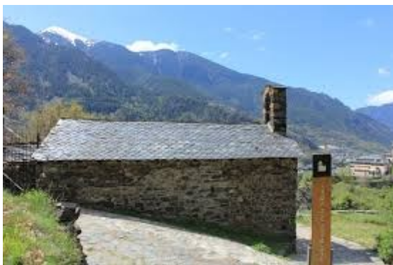
La calma d'Engordany